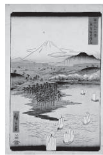
上左: 歌川広重「山海見立相撲 摂津有馬山」当館蔵(前期展示) 上右: 歌川広重「東海道五拾三次 宮」当館蔵(後期展示) 下左: 歌川広重「(魚づくし くらだい こだいに山椒)」当館蔵(前期展示) 下右: 歌川広重「富士三十六景 武蔵野毛横はま」当館蔵(後期展示)