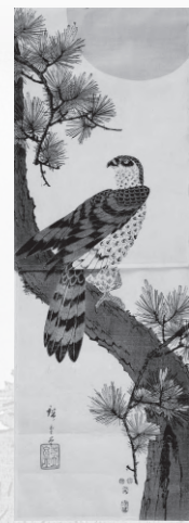
上：歌川広重「不二三十六景 東都江戸橋日本橋」当館蔵 下左：歌川広重「富士三十六景 駿河三保松原」当館蔵 下右：歌川広重「松に鷹」当館蔵(田中コレクション)