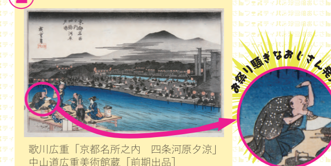
歌川広重「京都名所之内 四条河原夕涼」 中山道広重美術館蔵 [前期出品]