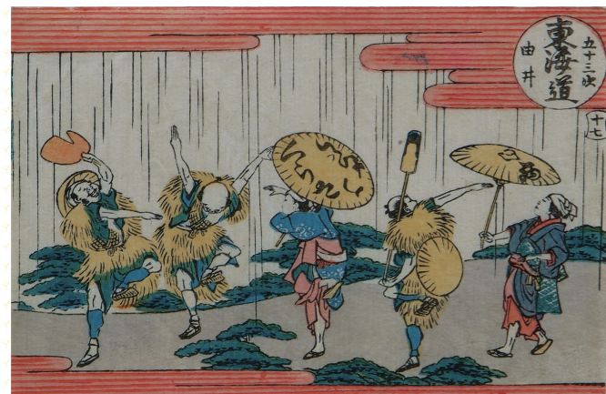
葛飾北斎「東海道五十三次 由井」 メ〜テレ(名古屋テレビ放送)蔵 [後期出品]