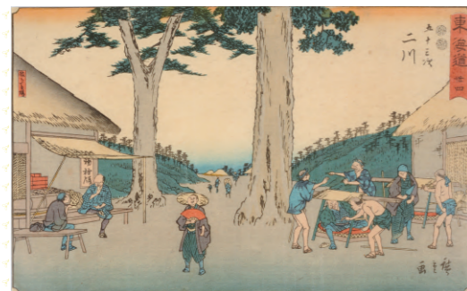
歌川広重「東海道 廿四・五十三次 二川」 中山道広重美術館蔵 [前期出品]