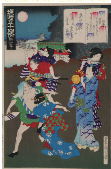
豊原国周「現時五十四情 第二十三号 初音」 メ〜テレ(名古屋テレビ放送)蔵 [前期出品]