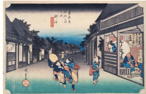
歌川広重「東海道五拾三次之内 御油 旅人留女」 中山道広重美術館蔵 [前期出品]